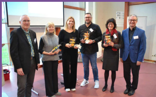
Brücken bauen in die Zukunft