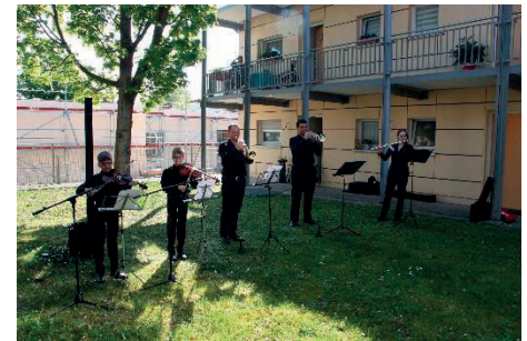
musikalischer Flashmob im Garten des Altenzentrums