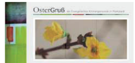
Karte als Ostergruß