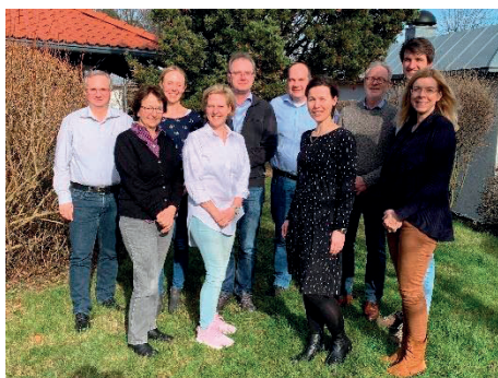
Der Kirchengemeinderat in Hohenheim

Für den Sonntagvormittag standen danach vor allem die Ziele und konkreten Aufgaben der kommenden sechs Jahre auf der Tagesordnung. Wo wollen wir